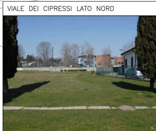
VIALE DEI CIPRESSI LATO NORD