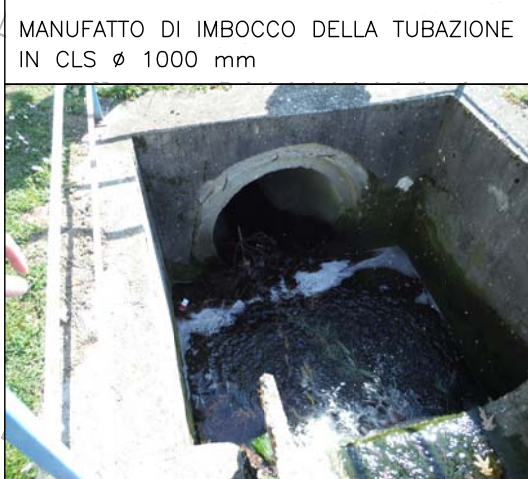
MANUFATTO DI IMBOCCO DELLA TUBAZIONE IN CLS ø 1000 mm