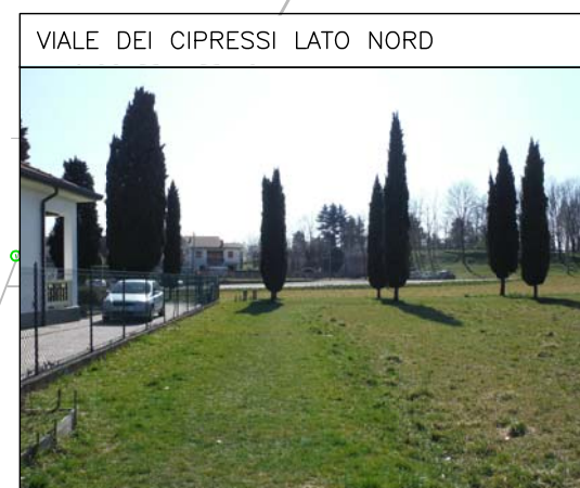
VIALE DEI CIPRESSI LATO NORD