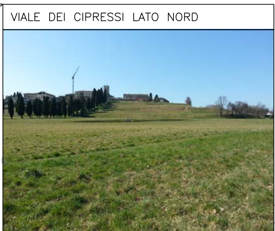
VIALE DEI CIPRESSI LATO NORD