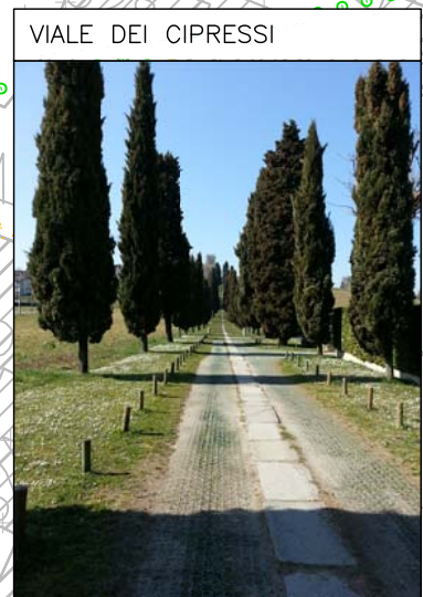
VIALE DEI CIPRESSI