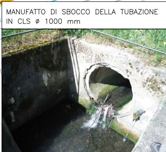
MANUFATTO DI SBOCO DELLA TUBAZIONE IN CLS ø 1000 mm