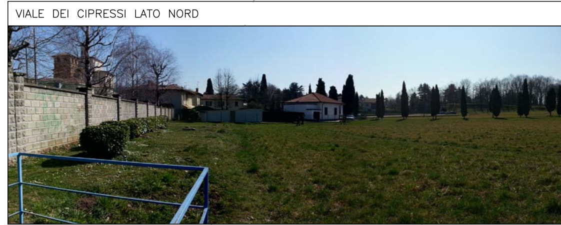
VIALE DEI CIPRESSI LATO NORD