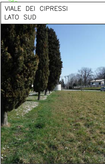
VIALE DEI CIPRESSI LATO SUD