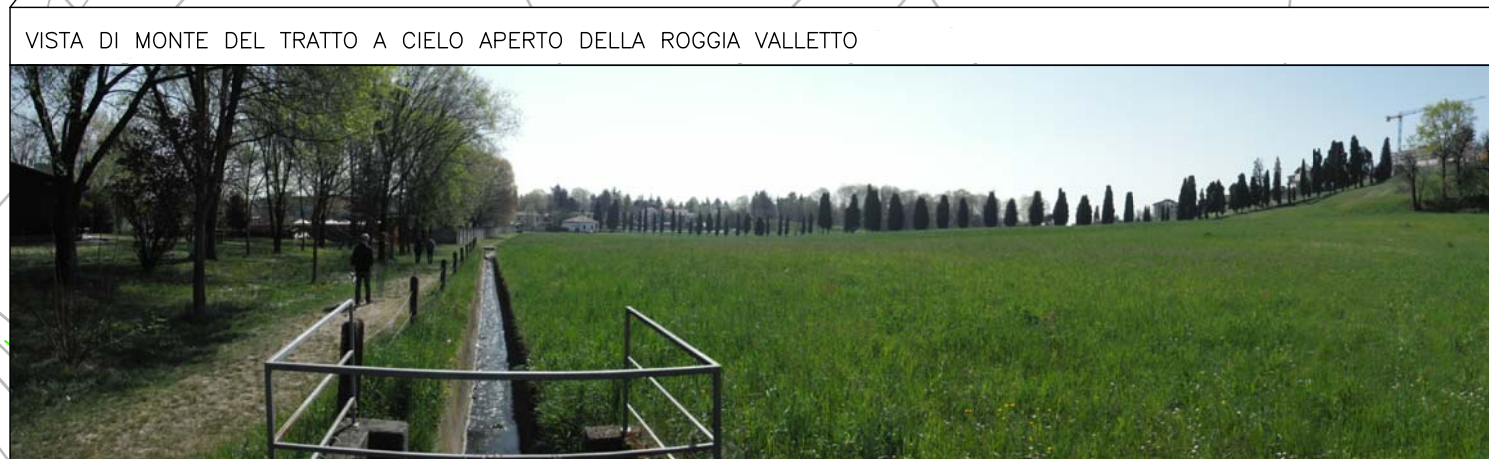
VISTA DI MONTE DEL TRATTO A CIELO APERTO DELLA ROGGIA VALLETTO